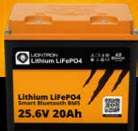
LIONTRON® LX Smart 25.6 V 20 Ah