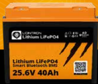
LIONTRON® LX Smart 25.6 V 40 Ah

Capacidad: 20 Ah / 512 Wh Voltaje de carga: 28.8 V Corriente máxima de descarga (continua / pico): 20 / 40 A BMS integrado / Bluetooth: Sí / Sí Dimensiones (L x An x Al): 198 x 152 x 170 mm Peso: 5.7 kg