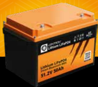
LIONTRON® LX Smart 51.2 V 50 Ah