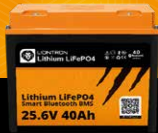
LIONTRON® LX Smart 25.6 V 40 Ah