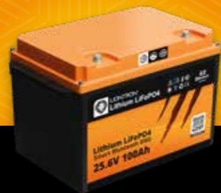
LIONTRON® LX Smart 25.6 V 100 Ah