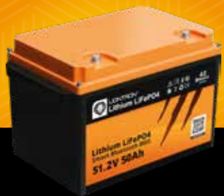
LIONTRON® LX Smart 51.2 V 50 Ah