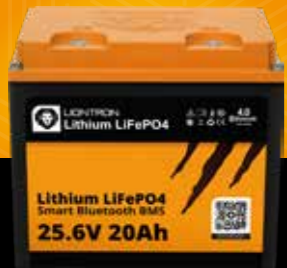
LIONTRON® LX Smart 25.6 V 20 Ah