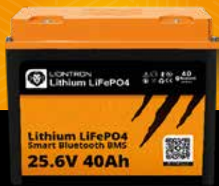
LIONTRON® LX Smart 25.6 V 40 Ah