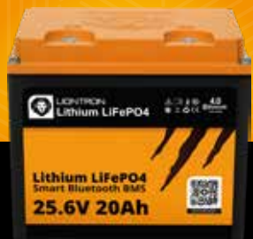
LIONTRON® LX Smart 25.6 V 20 Ah