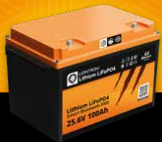
LIONTRON® LX Smart 25.6 V 100 Ah